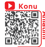
Paragrafın Anlam ve Yapı Yönü