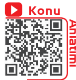
Anlatım Biçimleri / Düşünceyi Geliştirme Yolları